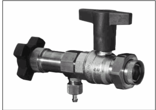
Oventrop ”Demo-Block” (M 30 x 1,5 / M 30 x 1,0)